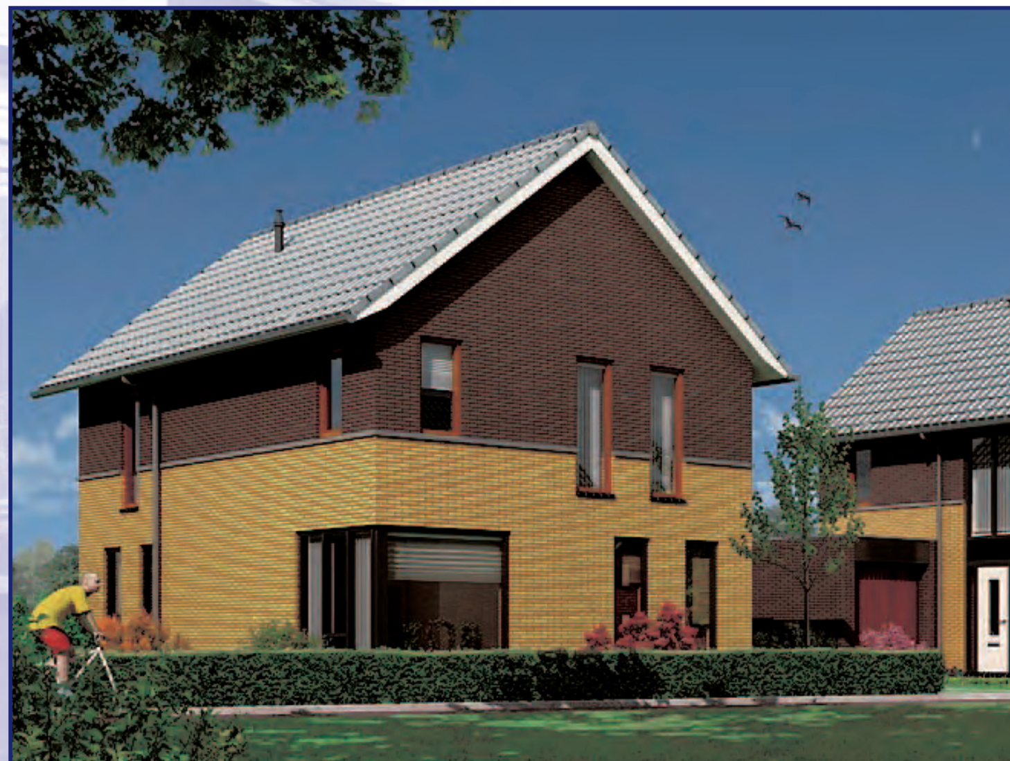
Type 'De Linde'

Interesse in ruim en betaalbaar wonen in Gorredijk? Plan Trimbeets is een uitgelezen kans voor mensen die voor een betaalbare prijs vrij willen wonen in een levendig dorp. Neem gerust contact op met Makelaardij Sierd Moll voor meer informatie over dit aantrekkelijke project. Tel. 0513-460101.