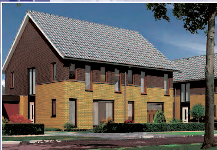
Type 'De Tsjonger'

4 Het aantal medewerkers bij Makelaardij Sierd Moll