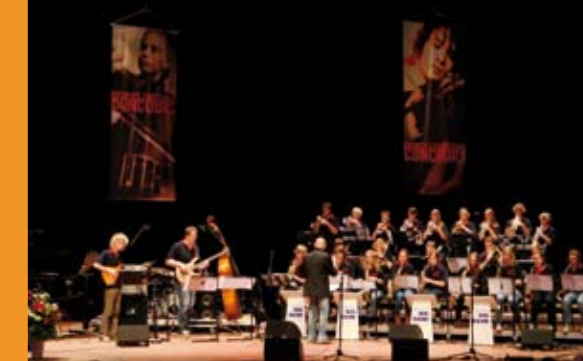
Prinses Christina concours

2011 is een jubileumjaar voor de Bogerman Bigband! De Bigband viert het 25-jarig bestaan met concerten, een jubileumdvd en speciale uitzendingen op Omrop Fryslân.